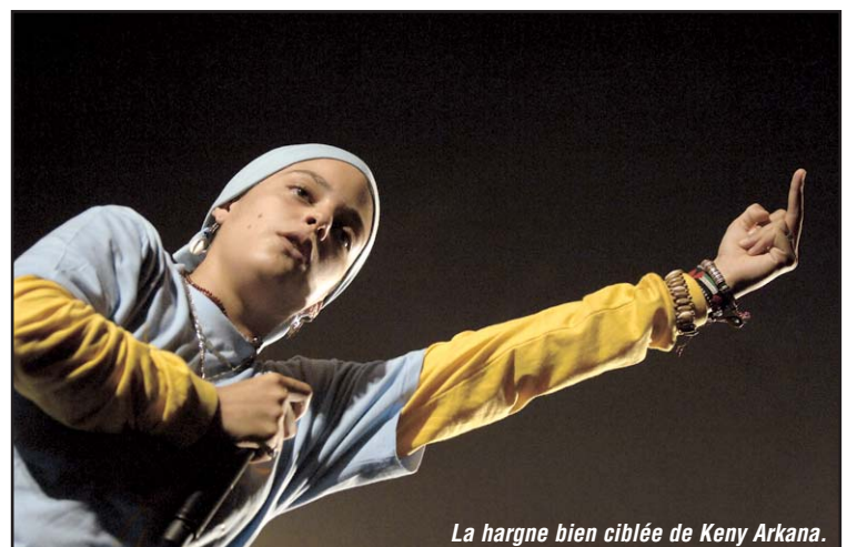
La hargne bien ciblée de Keny Arkana.